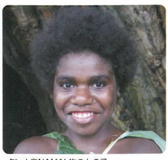
タンナ島NAMAL族の女の子

3月10日~17日、南太平洋に浮かぶ群島国、バヌアツを視察しました。首都のあるエファテ島、ヌナ島、タンナ島を巡り、病院や診療所で行われている予防接種の現場に立ち会ってきました。今後は、JCVからのワクチン支援を、徐々にバヌアツの保健省が引き継ぐという計画を聞き、被災国という立場から、自立への道を歩んでいることを感じました。