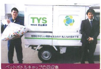
ペットボトルキャップの回収車

徳山商事は、大阪府貝塚市にある再生資源回収企業。近隣の幼稚園や小中学校から回収したペットボトルキャップを換金して寄付する活動を行っています。大阪でJCVのイベントが開催された時には、そのイベントで集まったペットボトルキャップを回収するために会場へ来て下さいました。ご寄付以外のこうしたボランティア活動も、JCVの大きな支えとなっています。