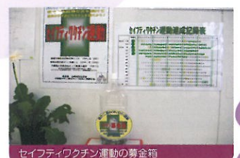
セーフティワクチン運動の募金箱

鹿島建設は、京都と長浜の現場でJCVの募金箱を設置。ただ置くだけではなく、「セーフティワクチン運動」と名付けた素晴らしいルールのもと、現場作業の無事故無災害1日につき、ポリオワクチン1人分(20円)を募金箱へ寄付しています。職場の皆さんの命を守る運動が、発展途上国の子どもたちの命を守る活動につながっているご支援です。