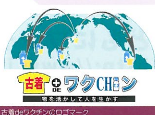
古着deワクチンのロゴマーク

リユース品、リサイクル品の輸出や販売などを手がける同社。株式会社リクルート発行の通販マガジン「eyeco」の「古着deワクチン」企画によってJCVに寄付した方が16,000件を超えました。これは誌上から「古着deワクチン」という商品を購入すると、ポリオワクチン5人分(100円)を寄付できるという企画です。昨年11月のスタート以来、約7万6000人分のワクチンを、JCVを通じて、途上国の子どもたちに贈っています。