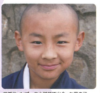
首都ティンブーの小学校で出会った男の子

昨年9月、ブータン王国を視察しました。今回、はじめて東部まで足を伸ばしましたが、標高3,000mを超える山道を毎日8時間、4日続けて移動するという大変厳しい行程でした。しかし、ブータンではこれが日常。このような過酷な環境の中でも、ワクチンをしっかり管理して子どもたちのもとに届ける現場の苦労と努力を、身をもって知る事ができました。