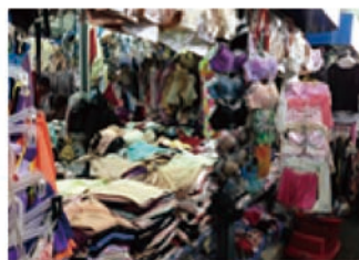
▲現地の店先に並ぶリユース下着