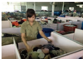
▲欧米各国から届いた下着を選別する 現地の女性。多くの雇用を送出