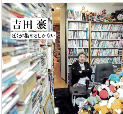
吉田豪 ぼくが集めるしかない