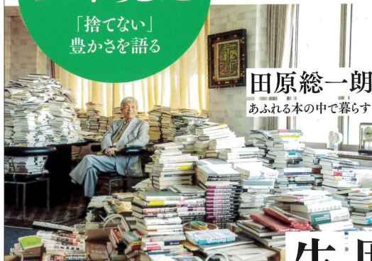
田原総一郎 あふれる本の中で暮らす