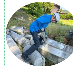
←お寺の灯籠が倒壊し通行できない状態の為撤去作業