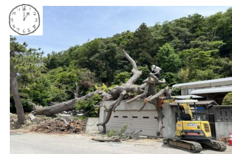
13:00 お寺の樹齢800年の御神木が倒れており危険な為、交通整理をしながら解体作業