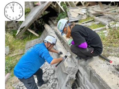
11:00 ボランティアメンバーみんなで話し合いながら作業を進めます