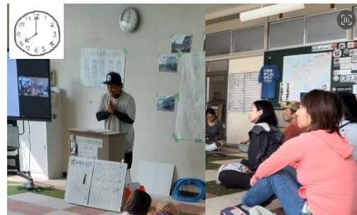
8:00 当日のボランティアメンバーの顔合わせ、チーム配置等ミーティング