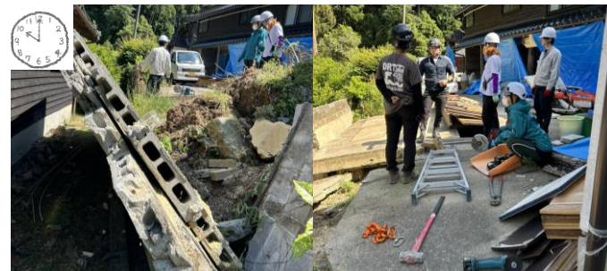
10:00 この日は輪島市にて依頼「民家ブロック塀が突き刺さっている、瓦礫撤去作業」